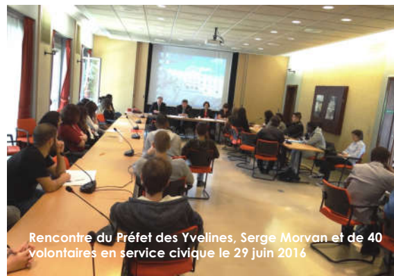
Rencontre du Préfet des Yvelines, Serge Morvan et de 40 volontaires en service civique le 29 juin 2016