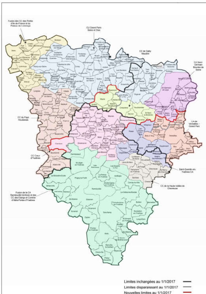
Arrondissements et intercommunalités des Yvelines au 1 er janvier 2017

Les acteurs de la transition énergétique ont pu bénéficier d'une présentation des dispositifs de financement des éco-projets et rencontrer des financeurs potentiels afin de mettre en œuvre leurs «Plans climat-air-énergie territoriaux» (PCET).