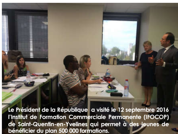
Le Président de la République a visité le 12 septembre 2016 l'Institut de Formation Commerciale Permanente (IFOCOP) de Saint-Quentin-en-Yvelines qui permet à des jeunes de bénéficier du plan 500 000 formations.

A ce jour, 41 demandeurs d'emploi ont déjà adhéré au dispositif. Au 1er décembre 2016, 35 dossiers ont reçu un avis favorable de l'UD 78 de la DIRECCTE IDF. Jusqu'à leur passage devant le jury, ces demandeurs d'emploi vont être accompagnés par l'AFPA 78 dans l'aboutissement de leur dossier de validation des acquis de l'expérience (VAE) et auront la possibilité de suivre des formations complémentaires à raison de 150 h par candidat.