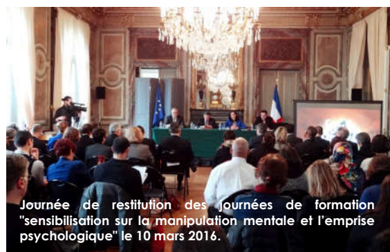
Journée de restitution des journées de formation "sensibilisation sur la manipulation mentale et l'emprise psychologique" le 10 mars 2016.

Des actions spécifiques ont été également mises en œuvre en partenariat avec l'Education Nationale à l'attention des directeurs des établissements scolaires, des infirmiers, travailleurs sociaux, médecins et CPE. En 2016, la Préfecture des Yvelines, l'Education Nationale et l'association «Entrée de jeu» ont ainsi mis en place une action de formation sous forme d'un débat interactif, à partir de cas pratiques tirés de situations réelles. Une action a aussi été menée avec la compagnie de théâtre «Masquarades».