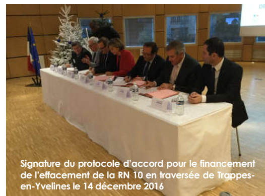
Signature du protocole d'accord pour le financement de l'effacement de la RN 10 en traversée de Trappes-en-Yvelines le 14 décembre 2016