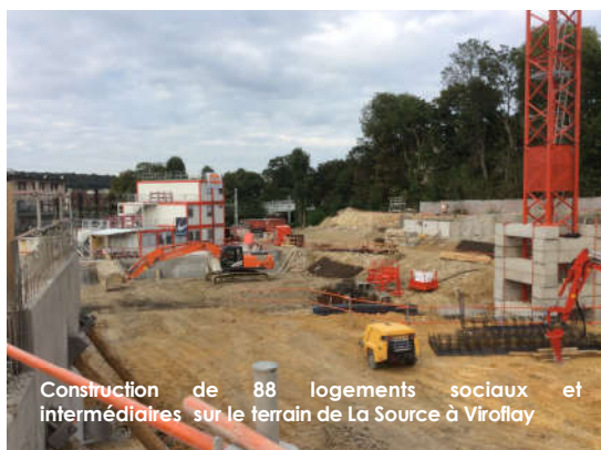
Construction de 88 logements sociaux et intermédiaires sur le terrain de La Source à Viroflay

L'année 2016 a permis de faire émerger trois projets sur les communes de Viroflay et Chatou dont les cessions sont prévues pour le début 2017.